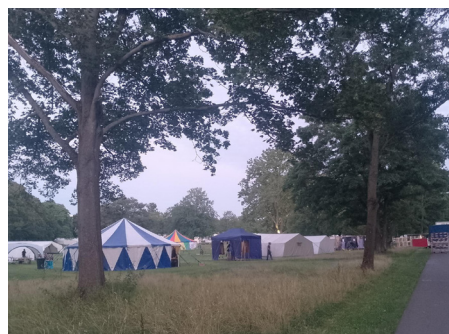
Blick auf die Menge der Workshop-Zelte II

In Baden-Württemberg wurde die Karte übrigens in einigen vVLandkreisen bereits Anfang des Jahres eingeführt, weitere sind, ebenso wie eine länderübergreifende Maßnahme, im Gespräch.