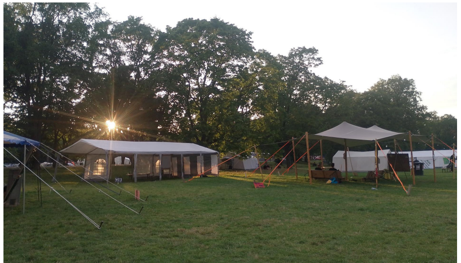
Workshopzelte auf dem Camp Gelände Hier haben viele WfGA-Workshops stattgefunden.

Die Führungen über das Camp werden ebenfalls gut angenommen. Einer meiner Teilnehmer vom Vortag versucht sogar, draußen auf der Straße Menschen hierher einzuladen. Der Organisation des