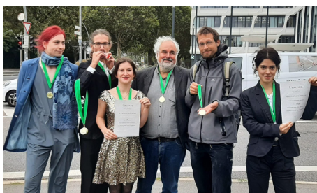
Engagiert in der Klimabewegung

Was verursacht die größten CO 2 -Emissionen? Nein, nicht der Auto-Verkehr, nicht die Flugindustrie oder die Stahlindustrie, sondern der Bausektor. Rund 40% Anteil, so die Architects for Future, gehen auf den Bausektor zurück und ca. 10% direkt auf die Bauindustrie. Mit „EndCement“ https://end-cement.earth/ haben wir in Heidelberg im Frühjahr eine regionale Kampagne mit überregionaler Ausstrahlung begonnen. Mit dabei sind u.a. „Fridays for Future“, „Letzte Generation“, und „Extinction Rebellion“, die „Architects for Future“, sowie die Werkstatt für Gewaltfreie Aktion. Wir treffen uns wöchentlich im Büro der Werkstatt im Heidelberger Welt-Haus und regelmäßig in Arbeitsgruppen.